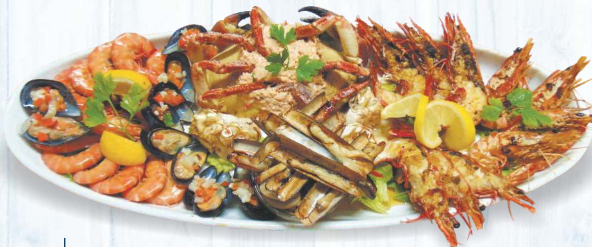
Variado de Marisco Quente & Frio 70.00€