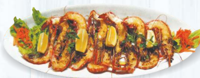
Camarão Grelhado 10/15