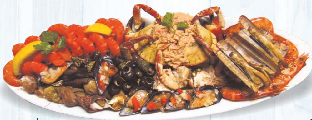
Variado de Marisco Pequeno 48.00€