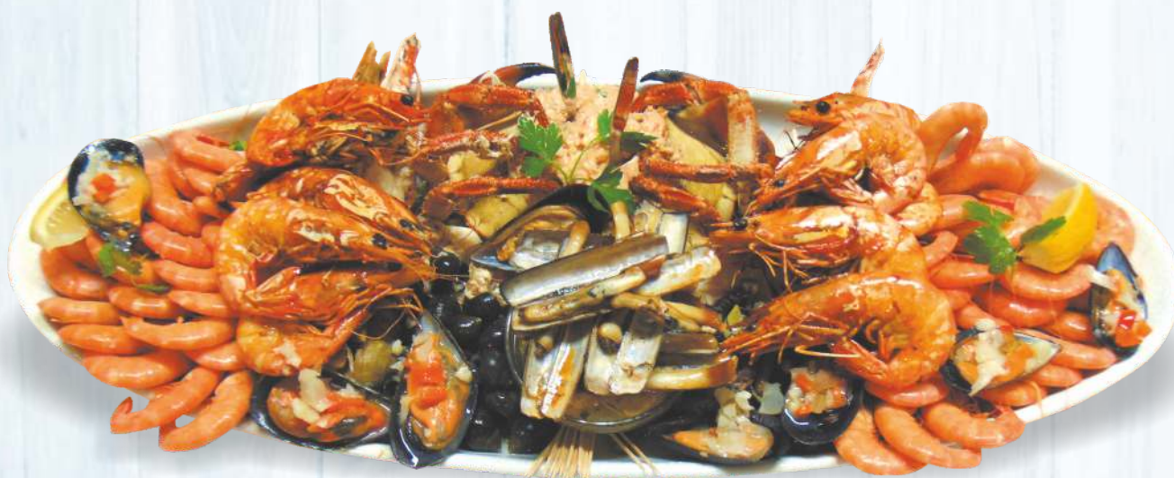
Variado de Marisco Á Príncipe 95.00€