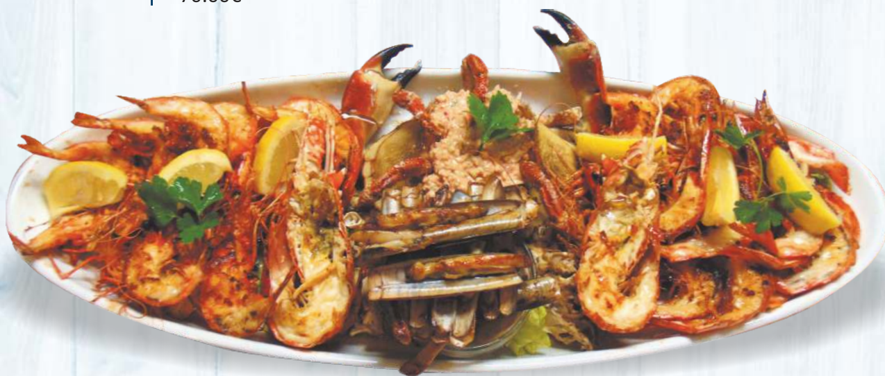
Variado de Marisco Á Príncipe Especial Grelhados 105.00€