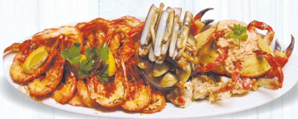
Variado Marisco Especial Grelhados Pequeno 55.00€