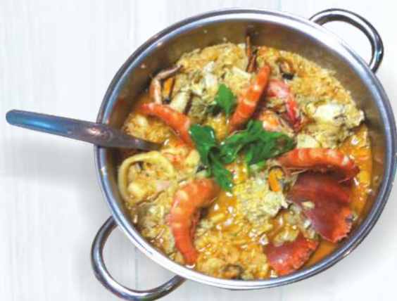
Arroz de Marisco